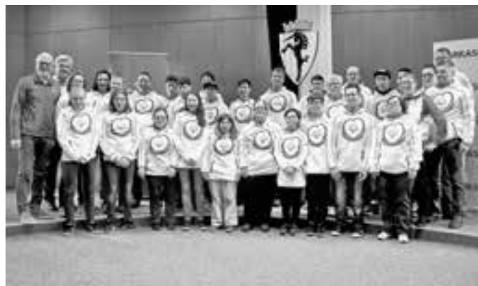
Die erfolgreichen Sportler/innen in der Steiermark.

Die Bevölkerung ist herzlich eingeladen, den Athletinnen und Athleten am Samstag, 25. März 2017, zwischen 18.00 und 19.00 Uhr, Am Garnmarkt , einen würdigen Empfang zu bieten. Für die musikalische Umrahmung sorgt die Gemeindegemeinschaft Götzis 1824.