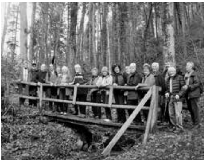
Die gemeinsamen Wanderungen in der Region erfreuen sich großer Beliebtheit.

Die nächste Wanderung findet am Mittwoch, dem 29. März 2017 , mit Treffpunkt um 14 Uhr beim Haus der Generationen, statt. Gewandert wird rund zwei Stunden bei jeder Witterung. Es ist keine Anmeldung erforderlich.