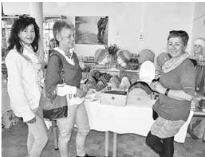
Die wunderschönen Handwerksstücke begeisterten die Gäste der Werkausstellung.