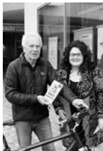
Locker Hermann, Götzis

Wer mitmachen möchte, kann sich unter www.fahrradwettbewerb.at oder in einem der Gemeindeämter anmelden. Danach heißt es fleißig radeln und die Kilometer im Internet, per App oder im Fahrtenbuch eintragen. Das Fahrtenbuch gibt's in der jeweiligen Gemeinde und kann zum Stichtag am 28. September dort wieder abgegeben werden. Die Bekanntgabe des Kilometerstandes per Telefon oder E-Mail ist natür-