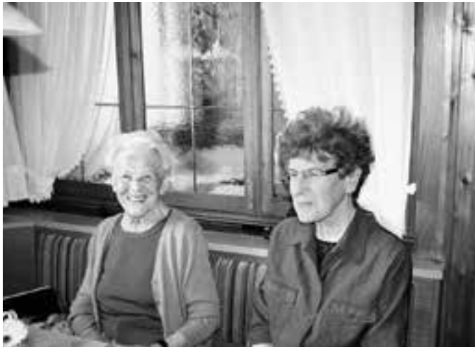
Gemeinsam gemütlich Mittag essen.