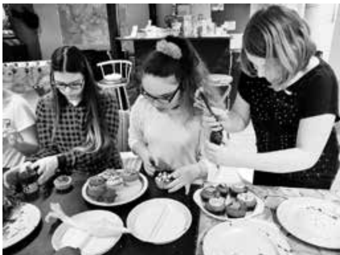
Das gemeinsame Backen machte den jungen Damen viel Spaß.

13. April 2017 statt. Auf Wunsch der Mädels gibt es einen Filmabend inkl. Übernachtung im Jugendtreff. Wer mit dabei sein möchte, kann sich ab sofort im Jugendtreff anmelden.